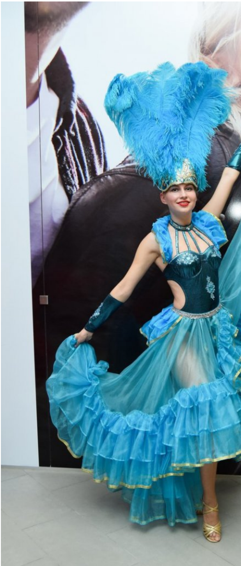
Прилагательное «смелая», действительно, как нельзя лучше